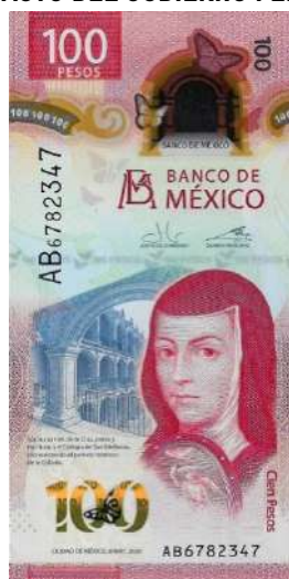
FIGURA 3. GASTO DEL GOBIERNO FEDERAL MEXICANO EN 2021 COMO PROPORCIÓN DE UN BILLETE DE 100 PESOS

Entre los gastos obligatorios del gobierno mexicano destaca el que se destina a las pensiones, que ha pasado de representar 9 de cada 100 pesos de gasto total en 2008 a 15 de cada 100 pesos del gasto total en 2021. Así, al considerar de manera conjunta el pago de la deuda, las pensiones y las participaciones a entidades federativas y municipios, los gastos ineludibles del gobierno federal representaron casi 40 de cada 100 pesos del gasto total en 2021 . Se espera que esta cifra se incremente en los próximos años con el envejecimiento de la población mexicana y el crecimiento de la deuda pública por el reciente aumento global de las tasas de interés.