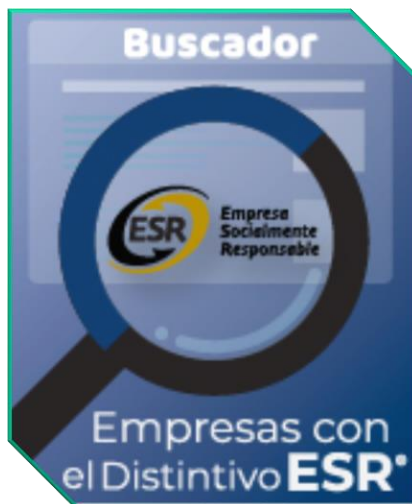
Buscador Empresas con el Distintivo ESR Centro Mexicano para la Filantropía, A.C. Disponible en: www.cemefi.org