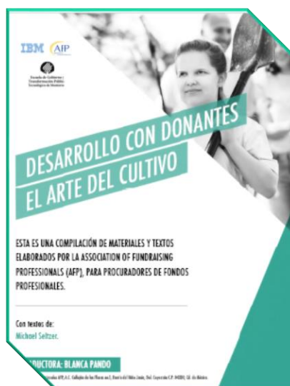
Desarrollo con donantes el arte del cultivo con textos de Michael Seltzer; traductora Blanca Pando. México : Asociación de Profesionales AFP, A.C. [2020]. 23 p.