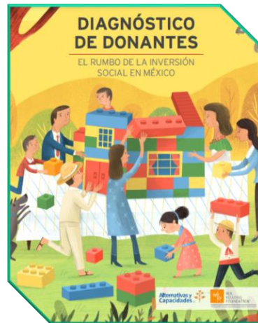
Diagnóstico de Donantes: el rumbo de la inversión social en México Alternativas y Capacidades, A.C. México: Alternativas y Capacidades, 2020